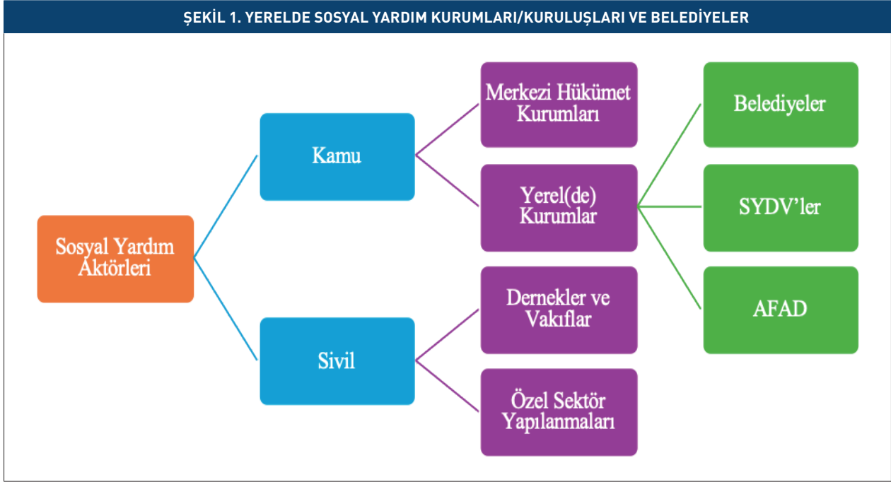
ŞEKİL 1. YERELDE SOSYAL YARDIM KURUMLARI/KURULUŞLARI VE BELEDİYELER

lıklara bağlı birimlerin farklı şekillerde sosyal yardım uygulamaları mevcuttur.