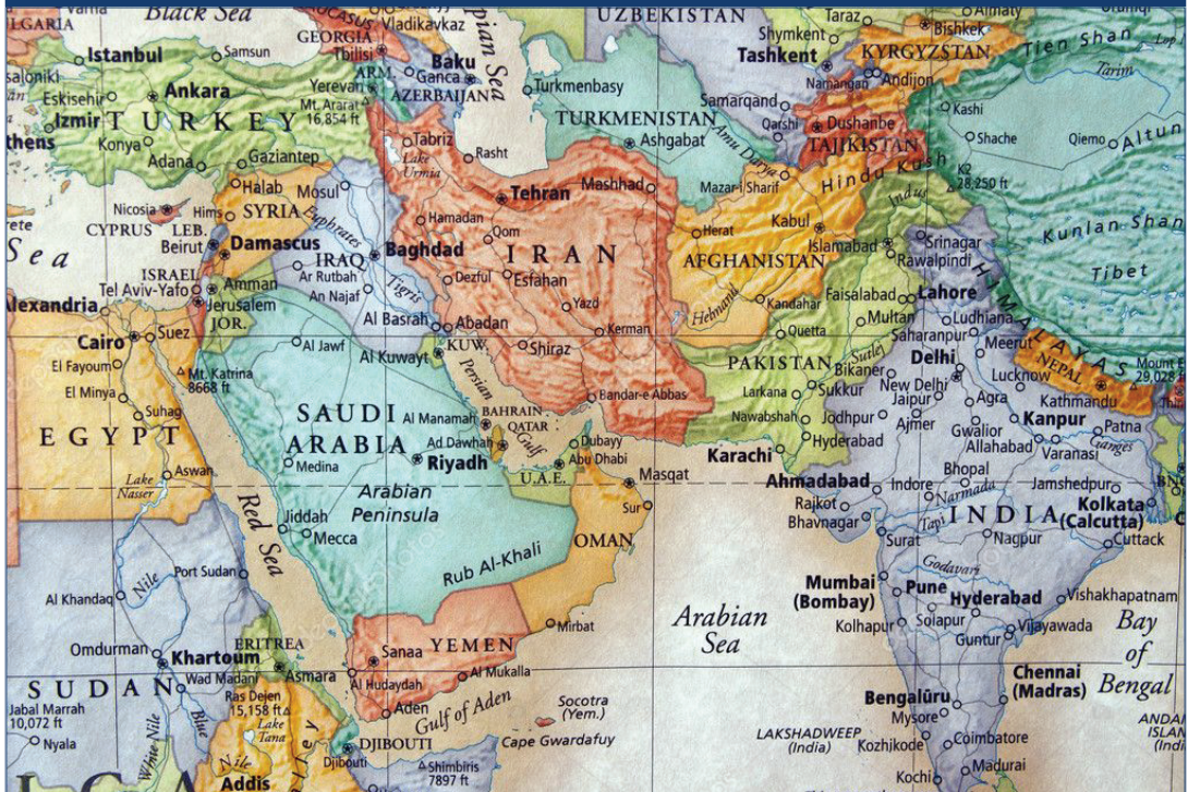
HARİTA 1. KÖRFEZ ÜLKELERİ VE AFGANİSTAN