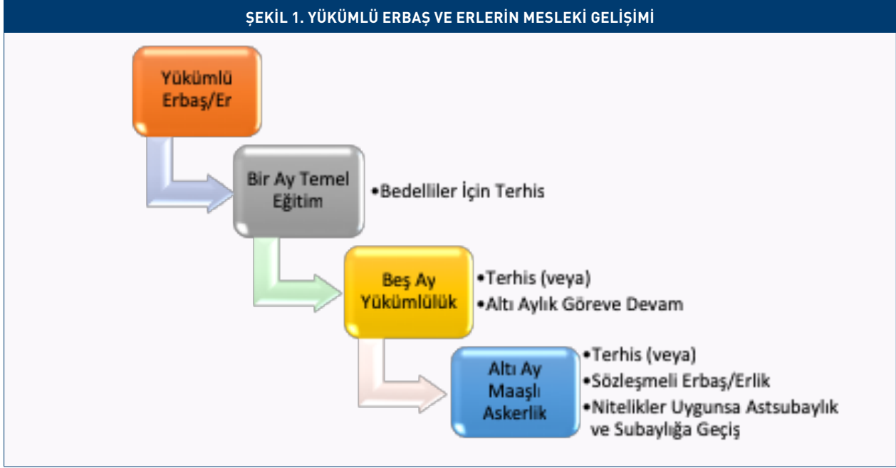
ŞEKİL 1. YÜKÜMLÜ ERBAŞ VE ERLERİN MESLEKİ GELİŞİMİ

Yükümlü kaynaklarından erbaş/erlere yönelik düzenlemelerde bedelli askerler dahil olmak üzere bir ay zorunlu temel askerlik eğitimi ön plana çıkmaktadır. Bu eğitim esnasında askerlik nosyonu kazandırma, silah tutma ve atış yapma gibi yeteneklerin geliştirilmesi gerekmektedir. Temel eğitimin sonunda erbaş ve erlerden bedelli askerlik tercihinde bulunanların terhisi mümkün kılınırken diğerlerinin beş ay daha askerlik hizmeti ifa etmesi ve temel askerlik dahil altı ayın sonunda eğer isterse ilave altı ay boyunca maaşlı olarak askerlik yapmasının önü açılmaktadır. İş sorunu yaşayan gençler için maaş alınabilecek altı aylık süre iş kurma, evlilik veya borç ödeme gibi maddi külfet getiren sorunların çözülmesine yardımcı olabilecektir. Bu süreç neticesinde sözleşmeli erbaş ve er olmanın önü açılmaktadır. Böylece TSK'nın profesyonel asker ihtiyacı karşılanırken iş sorunu yaşayan gençlerin düzenli maaşa kavuşması sağlanmaktadır.