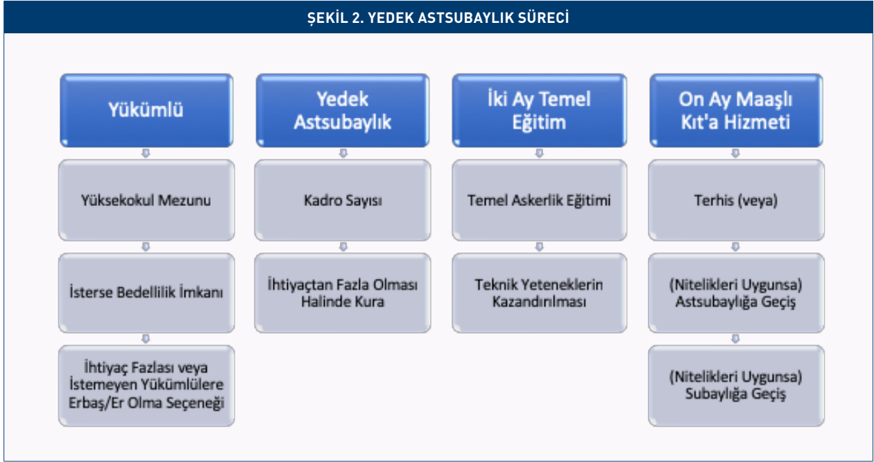
ŞEKİL 2. YEDEK ASTSUBAYLIK SÜRECİ

Yedek subaylık TSK için yeni bir kavram olmayıp lisans mezunu vatandaşların önceki dönemde de ifa ettiği yükümlülük çeşididir. Geçtiğimiz dönemde TSK'ya yükümlüler arasından kadro sayısı kadar yedek subay alınırken kadro fazlası olan askerler “kısa dönem” şeklinde altı ay süreyle askere alınmıştır. Ancak yeni sistemle kısa dönem askerlik sonlandırılmakta, onun yerine yükümlü erbaş/erlik getirilmektedir (Şekil 3). Dolayısıyla lisans eğitimi almış vatandaş idarenin ihtiyacı nispetinde yedek subaylık yapabilecektir. İhtiyaç fazlası yükümlü bedelli askerlik yanında yine ihtiyaç nispetinde belirlenen kadro sayısı dikkate alınarak yedek astsubay veya yükümlü erbaş/er olabilecektir. İki aylık temel askerlik döneminde temel askerlik eğitimi yanında küçük birlik komutanlığının gerektirdiği niteliklerin kazandırılması beklenmektedir. Müteakip on aylık hizmet süresinde maaş alınırken terhis olmak yanında uygun nitelikler taşıması halinde subay kadrosuna atanmanın önü açılmıştır. Böylece lisans eğitimi almış nitelikli gençlerin herhangi bir meslek edinmemeleri durumunda işsiz kalmalarının önüne geçilmiş, aynı zamanda TSK'nın subay ihtiyacının karşılanmasında kaynak çeşitliliğine gidilmiştir.